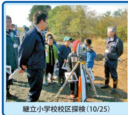
継立小学校校区探検(10/25)