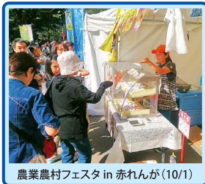
農業農村フェスタ in 赤れんが(10/1)