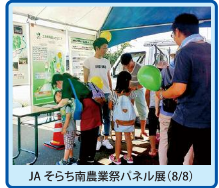
JA そらち南農業祭パネル展(8/8)