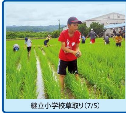
継立小学校草取り(7/5)