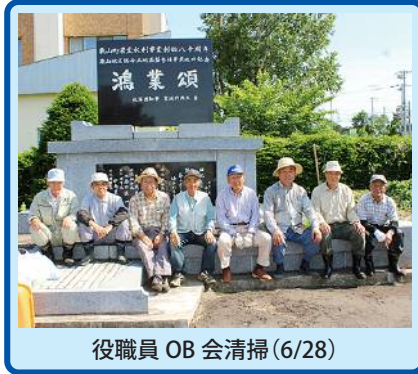
役職員 OB 会清掃(6/28)