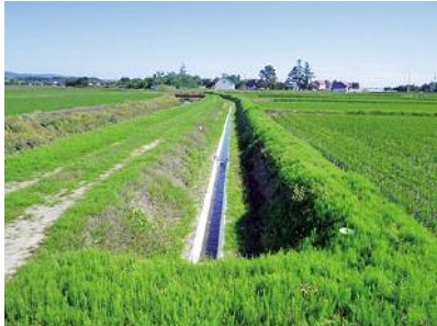
杵臼西部 41 工区