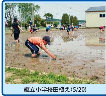
継立小学校田植え(5/20)