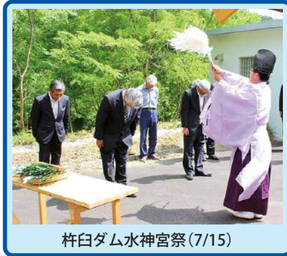
杵臼ダム水神宮祭(7/15)