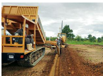
継立南部 61 工区