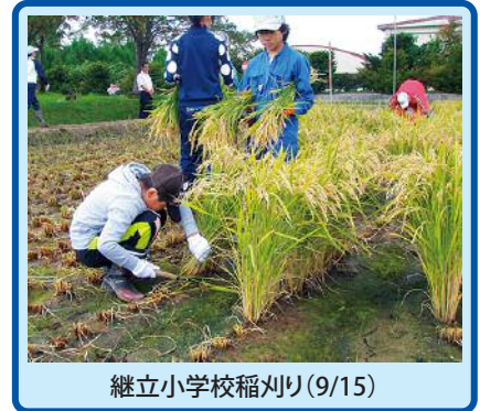
継立小学校稲刈り(9/15)