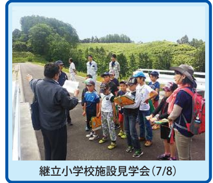
継立小学校施設見学会(7/8)