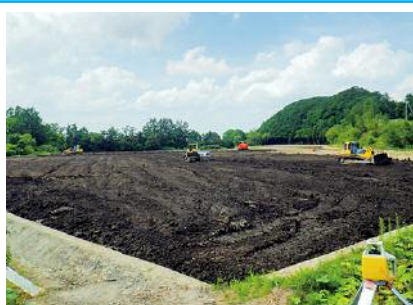
南角田南部 61 工区