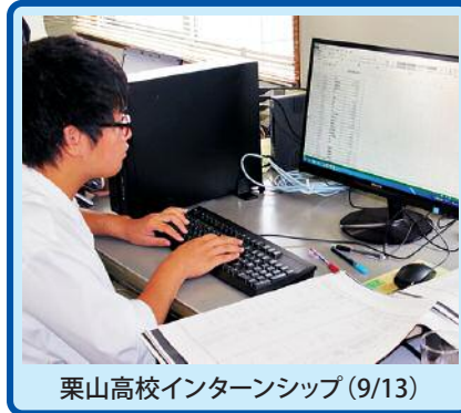
栗山高校インターンシップ(9/13)