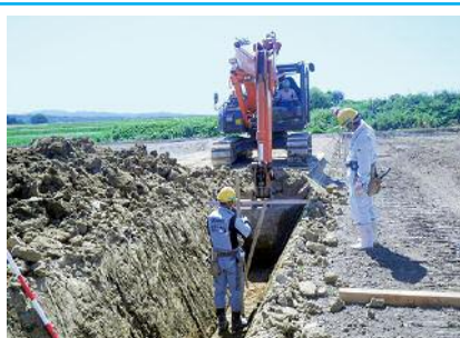
南角田北部 41 工区