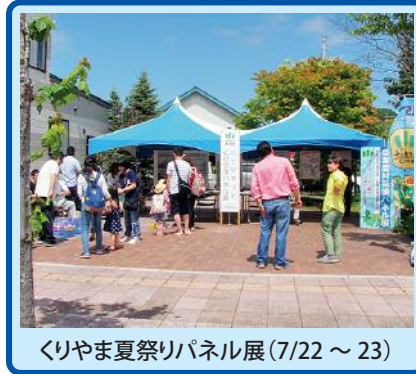
くりやま夏祭りパネル展(7/22～23)