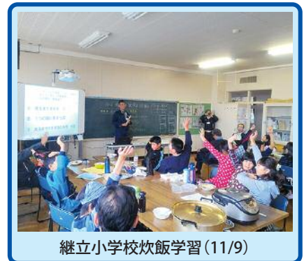
継立小学校炊飯学習(11/9)