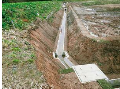
杵臼南部 41 工区