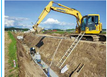
杵臼北部 41 工区